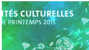
Activités culturelles de l'UNIGE Dans "L'Uni se cultive"